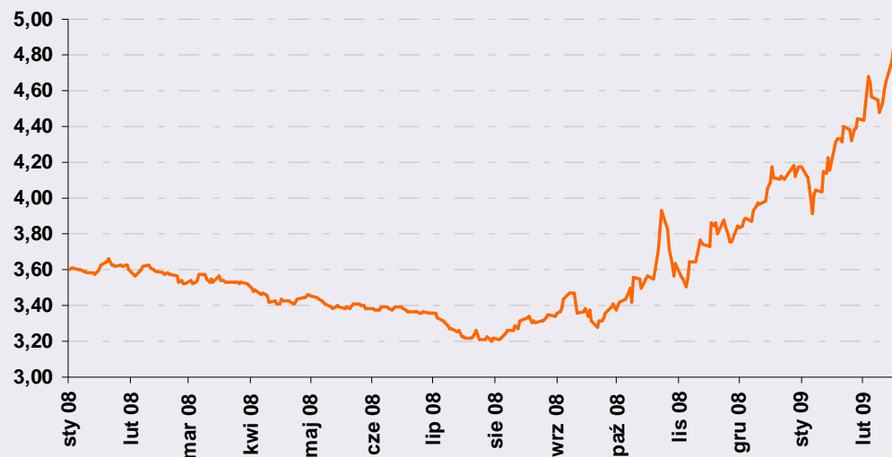
Kurs EUR/PLN na fixingu NBP od 02.01.2008r.

Obserwowana obecnie nerwowość na rynku związana jest z szybko zmieniającym się sentymentem (generalna awersja do ryzyka),